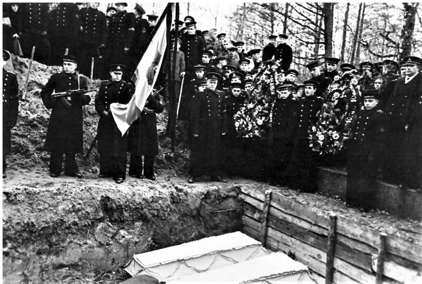
Братская могила на Кронштадтском кладбище