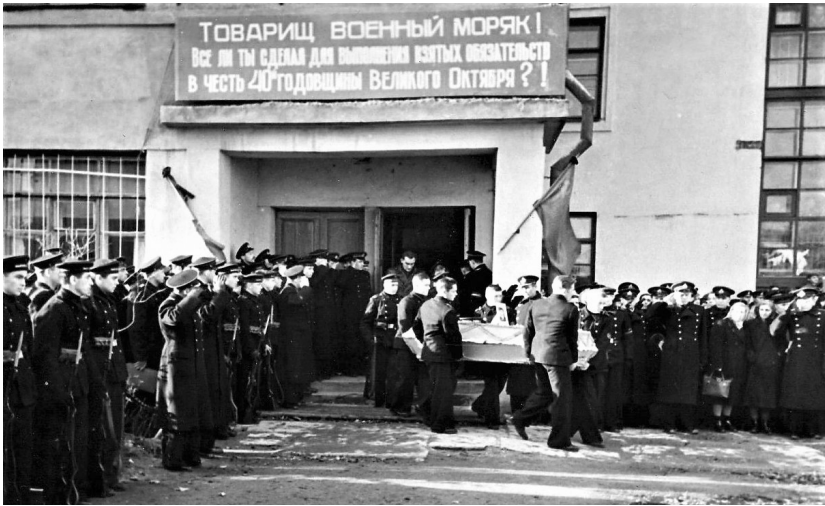
Товарищ военный моряк! Все ли ты сделал для выполнения взятых обязательств в честь 40-й годовщины Великого Октября?!

дников. Остальных членов экипажа взяло море. Гробы не вскрывались. Было великое горе родных и близких, были проклятия и угрозы в адрес тех, кто не сберег их детей, отцов, братьев. Несмотря на все принятые меры скрытности, о похоронах подводников знал весь Кронштадт.