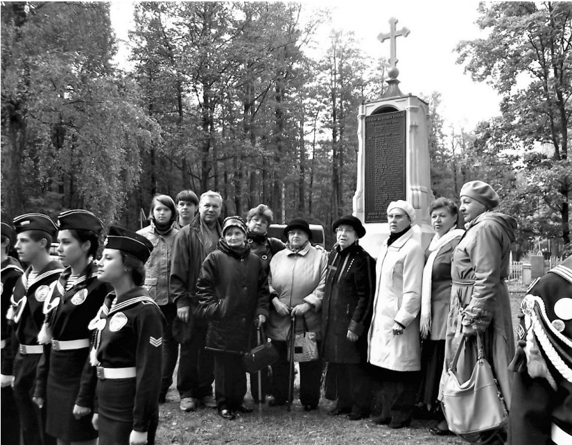
Кронштадт, 26 сентября 2012 года, 55-я годовщина гибели ПЛ М-256. Родные и близкие погибших