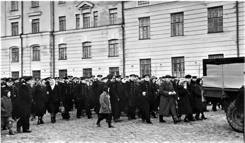
Весь Кронштадт вышел на похороны экипажа М-256