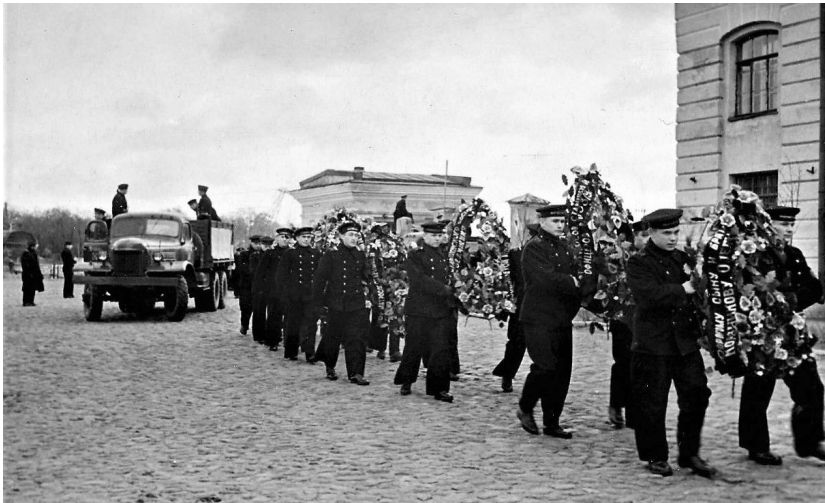
Похоронная процессия. Венки погибшим