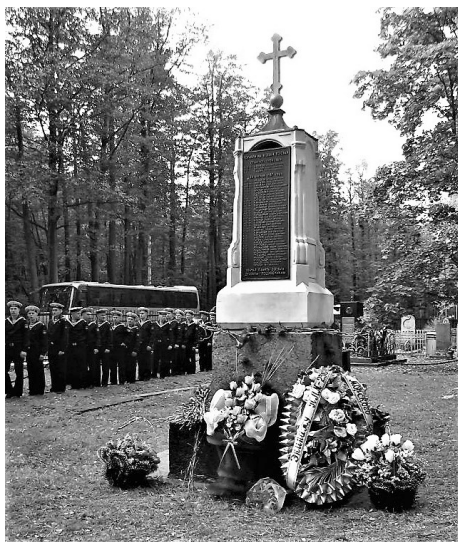
Кронштадтское воинское кладбище. Памятник экипажу подводной лодки М-256 (современный вид)