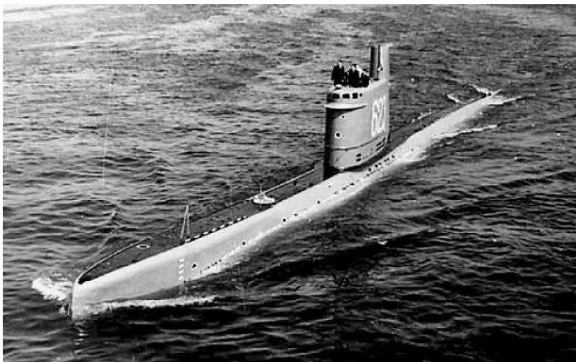
Подводная лодка проекта А615