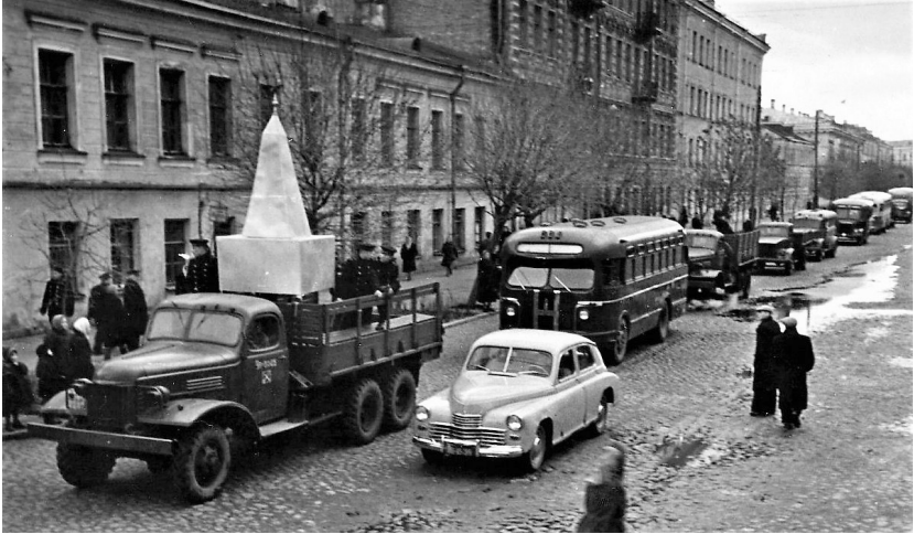
Похоронная процессия по центральным улицам Кронштадта

Из стихотворения штурмана М-256 Г. С. Масленникова Вот и вся недолга... Приспущен флаг. И на эсминце, в башне на корме Недвижимы, полукругом в ряд, Лежат в мешках ребята на броне.