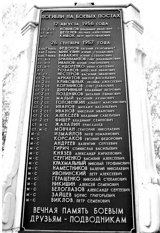
Памятник боевым друзьям-подводникам

Может быть, пора уже и прислушаться к этим словам?