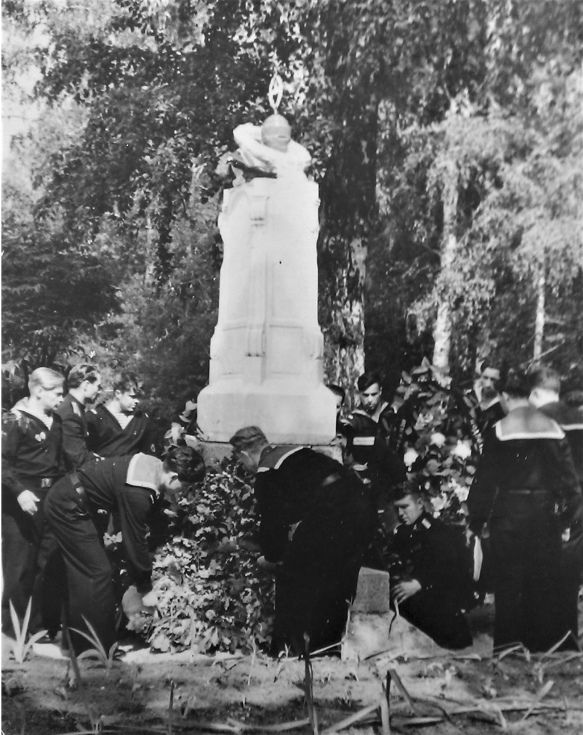
Первоначальный вид памятника погибшим подводникам М-256