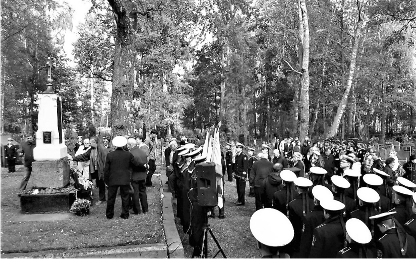
Возложение венков и цветов