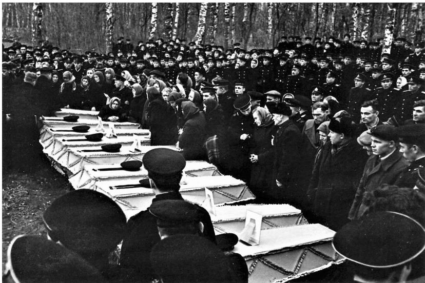
Похороны девяти членов экипажа М-256

Молюсь я за помин души Подводников, что полегли на дне. Понятно, что тела мертвы, Но души, души памятью во мне!