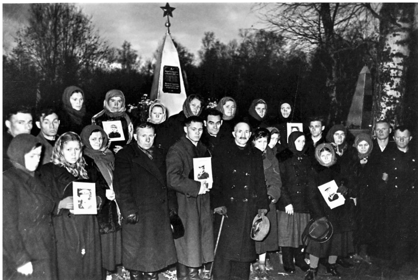
Родные и близкие похороненных подводников М-256 на Кронштадтском кладбище